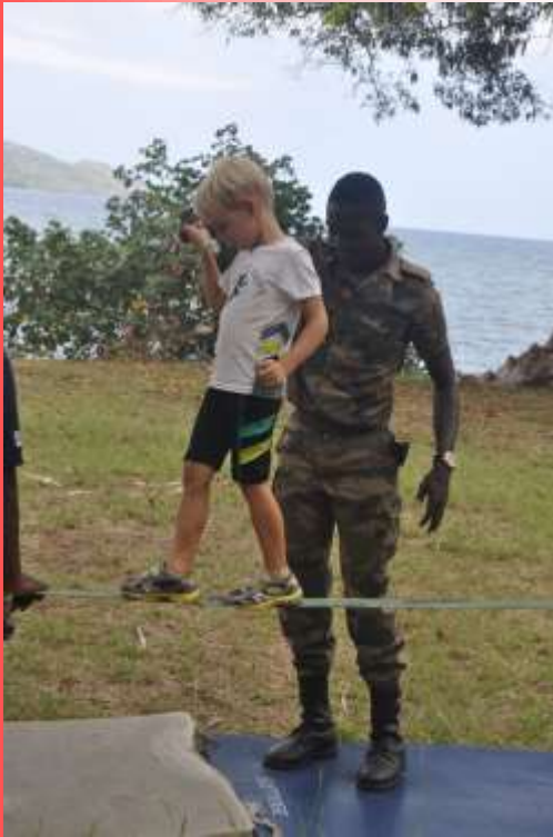
Animations sportives de plage gérées pour la partie natation par la section de l'Adj Franck