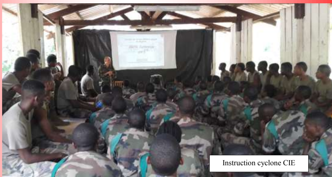
Instruction cyclone CIE

Après cette phase d'exercice, la compagnie s'est rassemblée afin de participer à la remise des bérets des Volontaires du contingent 2017/11 de la Formation militaire Initiale et aux remerciements de l'ensemble des cadres de la FMI qui quitteront la CFP2 l'an prochain, afin de rejoindre les rangs de la CFPI.